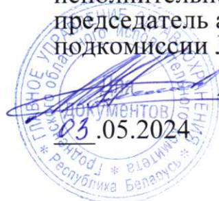
ГРАФИК АТТЕСТАЦИИ на присвоение квалификационных категорий врачам-специалистам хирургического профиля на 20 – 21 мая 2024 года